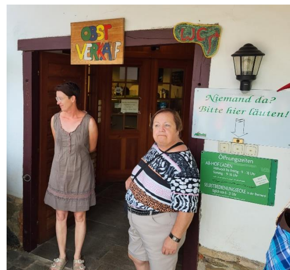
Beim Obsthof Wilhelm in Puch