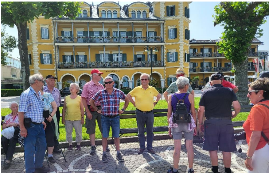
In Velden unterwegs